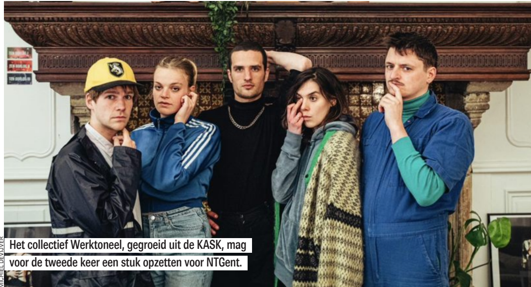
Het collectief Werktoneel, gegroeid uit de KASK, mag voor de tweede keer een stuk opzetten voor NTGent.

De Tremerie kwam onlangs in het nieuws omdat hij met een bevriende kok voor twee maanden een pastapop-up in de Kammerstraat opende. Hij krijgt vier grote rollen in dit nieuwe NTGent-seizoen. Zo krijgt hij een hoofdrol in Raus nieuwe productie die het seizoen afsluit, Antigone in the Amazon . Daaraan werken ook activisten van de Braziliaanse